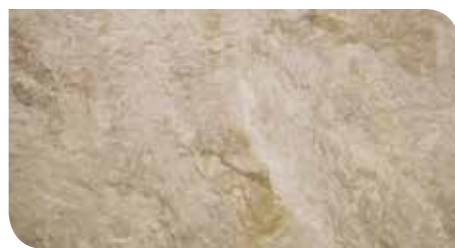
Verde | KLTCBT21098Z