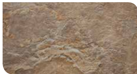
Smoke Quartz | KLTCBT21094Z