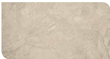
Blancos | KLTCBT21143Z