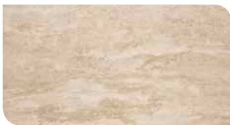
Lappato | KLTCBT21212Z