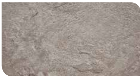
Agata | KLTCBT21206Z