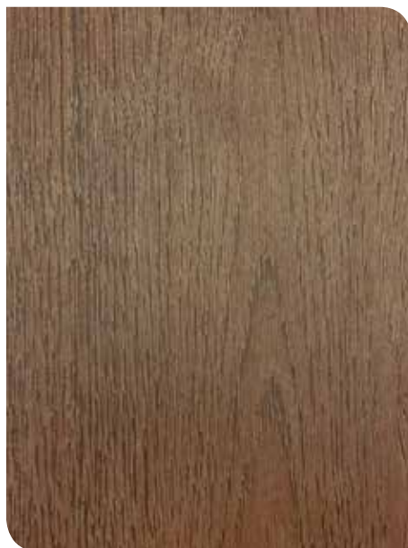
Findlay Oak | KPL117