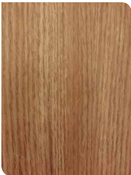
Dayton Oak | KPL411