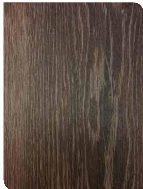
Lorain Oak | KPL614