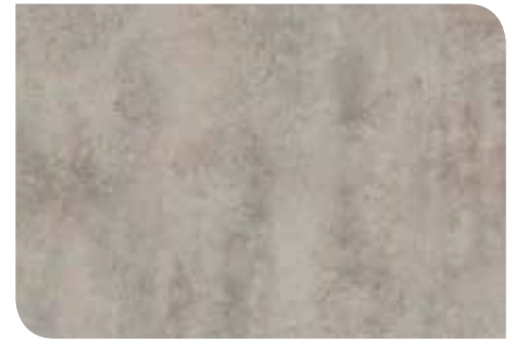
Ordesa Stone | KLTKRCT305