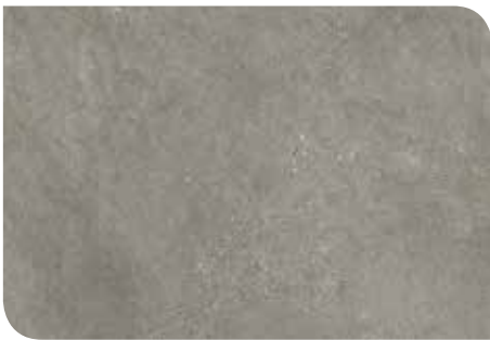
Sarek Limestone | KLTKRCT718