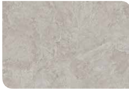
Saxon Stone | KLTKRCT096