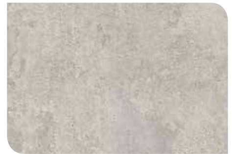
English Stone | KLTKRCT919