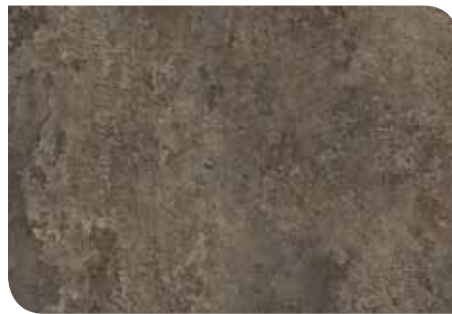
Hyde Stone | KLTKRCT911