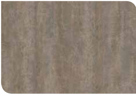
Labyrinth Stone | KLTKRCT028