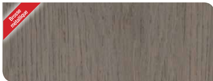
Antique Tin chêne KPHWB55H