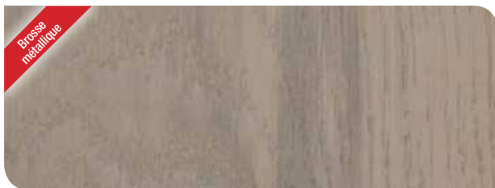
London Fog chêne KPHWB54H