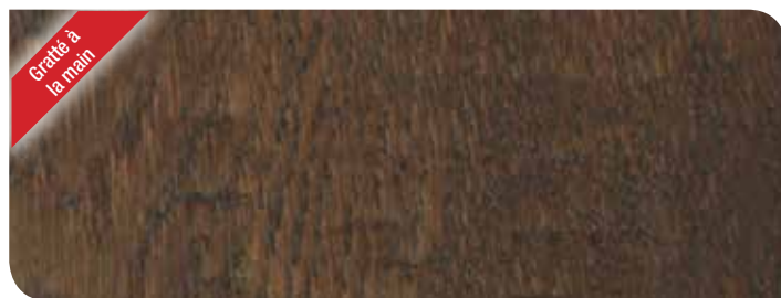
Whiskey chêne KPHWB53H